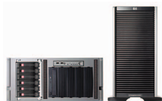
HP StorageWorks 600 一体化 存储系统