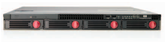
HP StorageWorks 400 一体化 存储系统