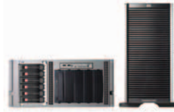
HP StorageWorks 600 一体化存储系统