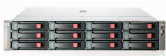
HP StorageWorks 1200 一体化 存储系统